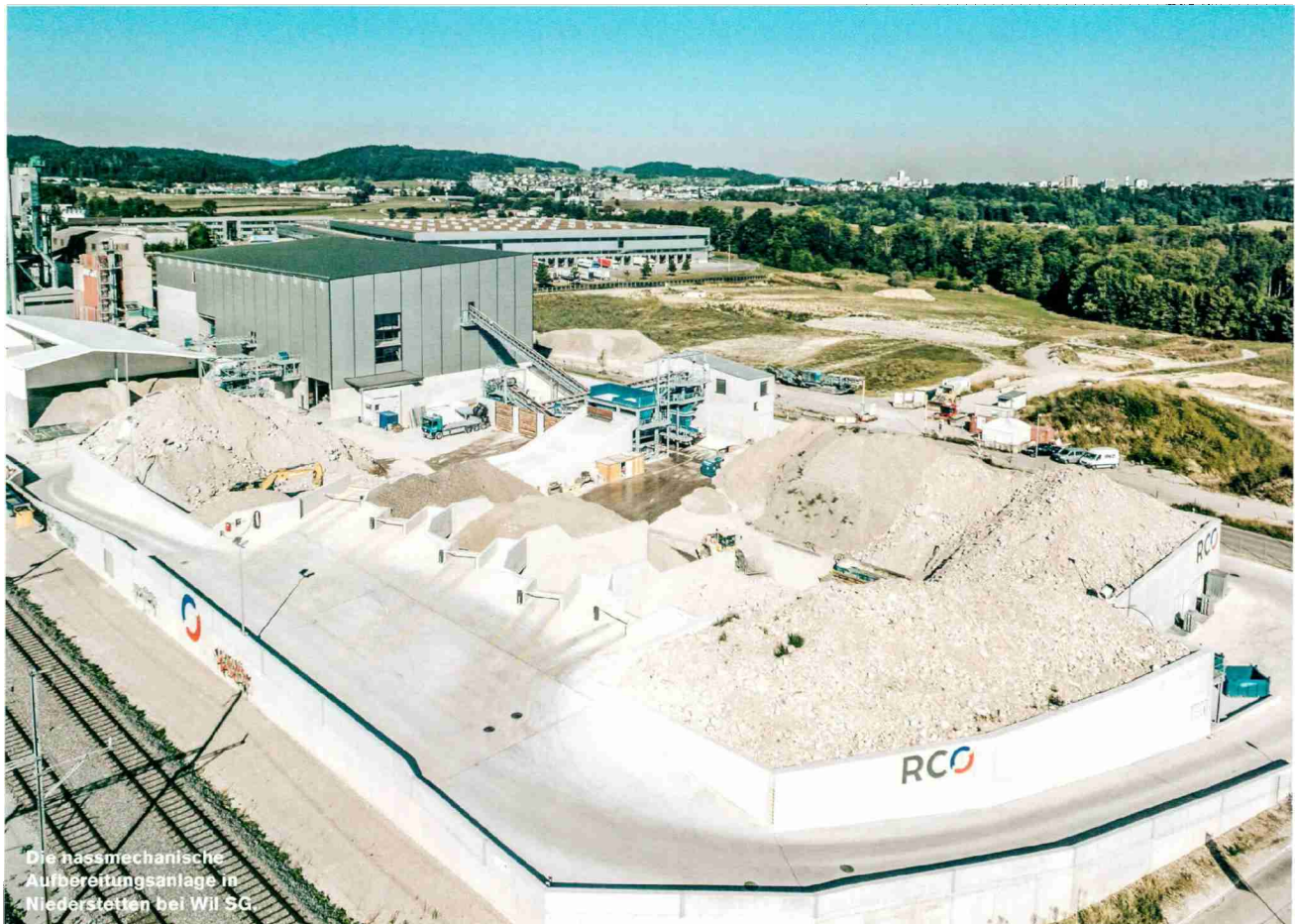
Die nassmechanische Aufbereitungsanlage in Niederstetten bei Wil SG